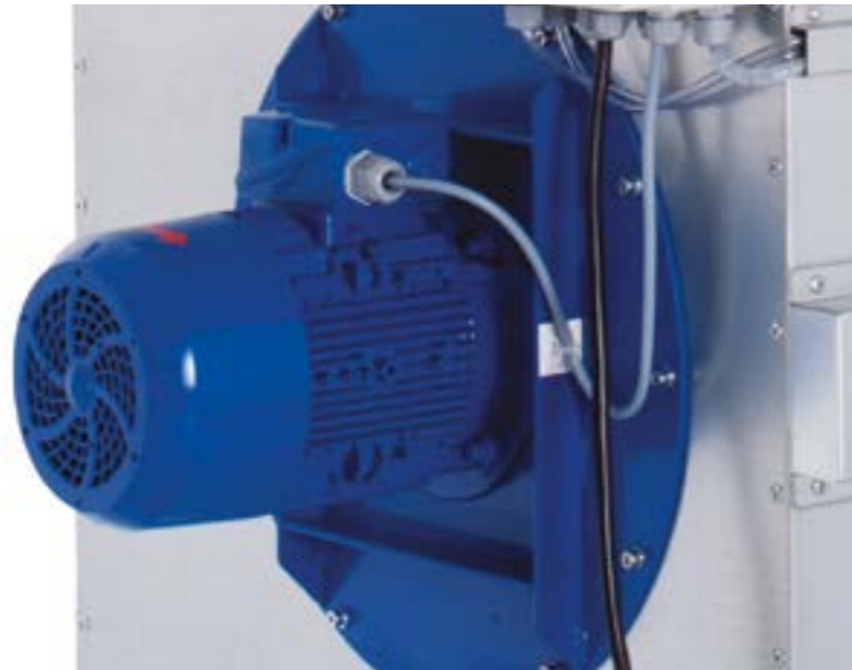
Рис. сверху: Vacumobil VT 200 с энергосберегающим двигателем 4.0 кВт (IE3)