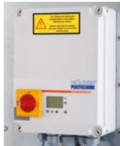
Рис. справа: управление PLC с текстовым дисплеем и прочной мембранной клавиатурой