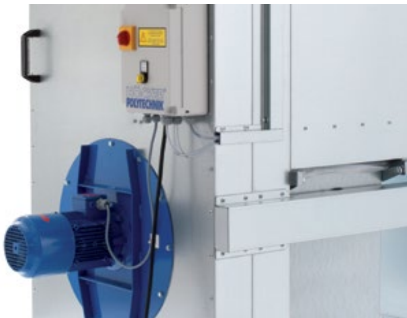
Рис. снизу: К съемному патрубку диаметром 140 мм может подключаться труба диаметром 160 мм.

Рис. снизу: Vacumobil VT 140/160 с энергосберегающим двигателем 2.2 кВт (IE3)