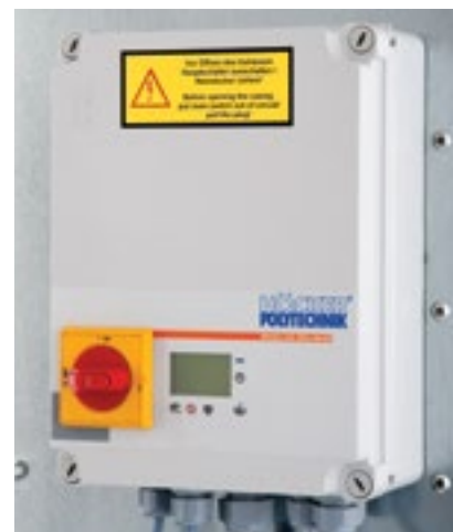
Рис. справа: управление PLC с текстовым дисплеем и прочной мембранной клавиатурой