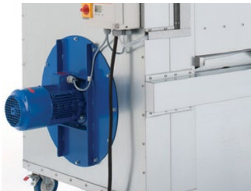
Рис. выше: Vacumobil VT 160 с энергосберегающим двигателем 2.2 кВт (IE3)