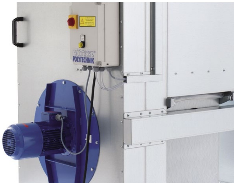
Рис. снизу: К съемному патрубку диаметром 140 мм может подключаться труба диаметром 160 мм.

Рис. снизу: Vacumobil VT 140/160 с энергосберегающим двигателем 2.2 кВт (IE3)